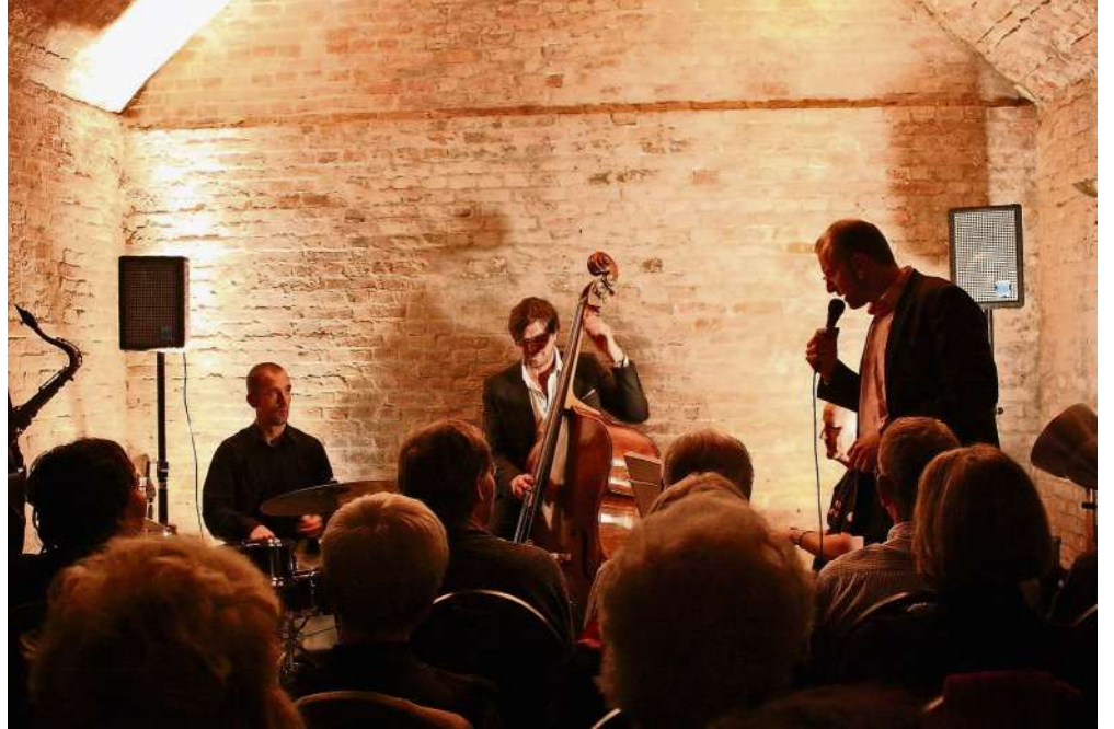
Das Gewölbe unter dem Ladengeschäft ist als Jazz-Bühne ein Geheimtipp.