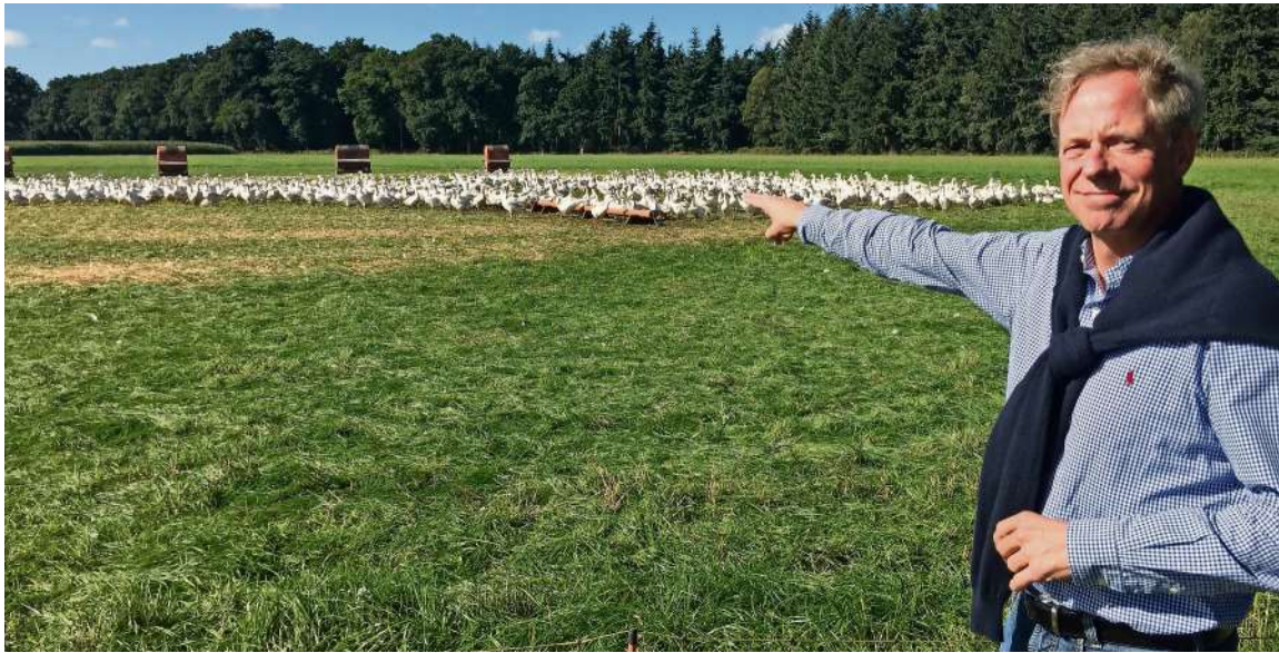
Ein Besuch bei seinen Daunen-Lieferanten: Stephan Schulze-Aissen vor einer Herde Gänse in Schleswig-Holstein.

Es gibt sie noch: Wunderbar leichte und warme Daunenbetten wie früher