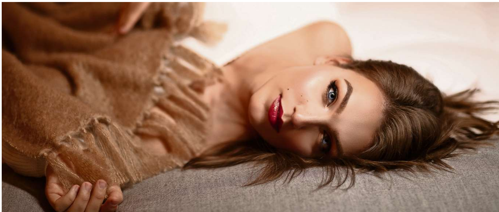
Ein guter Schlaf ist wichtig für das Wohlbefinden und die Leistungsfähigkeit.