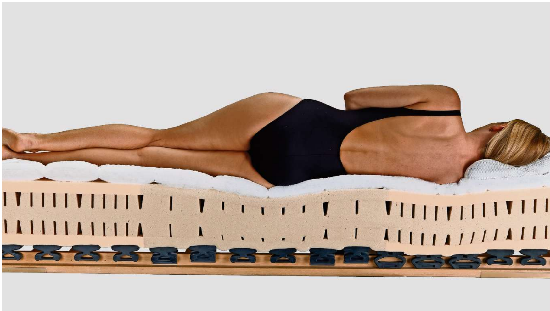
Die perfekte Kombination von Unterfederung, Matratze und Nackenkissen stützt die Wirbelsäule in jeder Position.