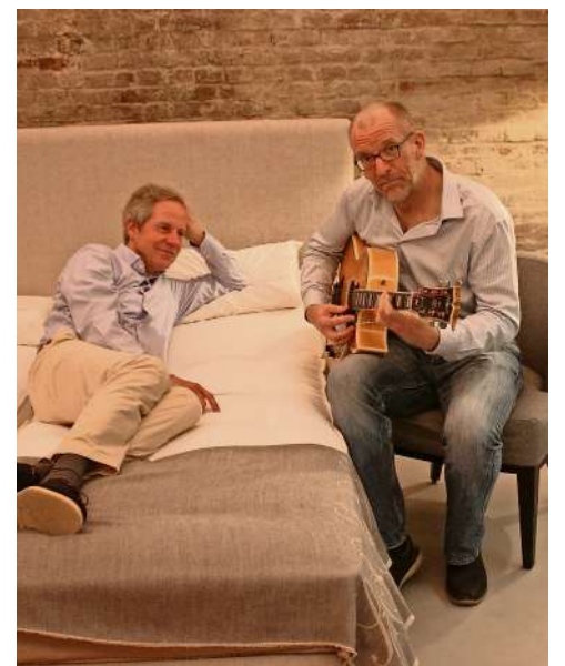
Beide träumen davon, dass es im Kellergewölbe bald wieder fürs Publikum groovt.