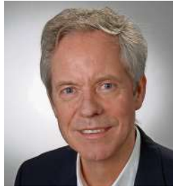
Textilbetriebswirt und öffentlich bestellter und vereidigter Sachverständiger für Heim- und Haustextilien.

Familienunternehmen in der vierten Generation und legt neben Fachwissen großen Wert auf soziale Kompetenz seiner Mitarbeiterinnen und Mitarbeiter. „Empathie und Ehrlichkeit sind die Schlüssel zum nachhaltigen Erfolg. Menschen spüren, wie es um das Betriebsklima in einem Geschäft bestellt ist. Die Arbeit muss Spaß machen, schließlich soll meine Besatzung auch ruhig schlafen können.“