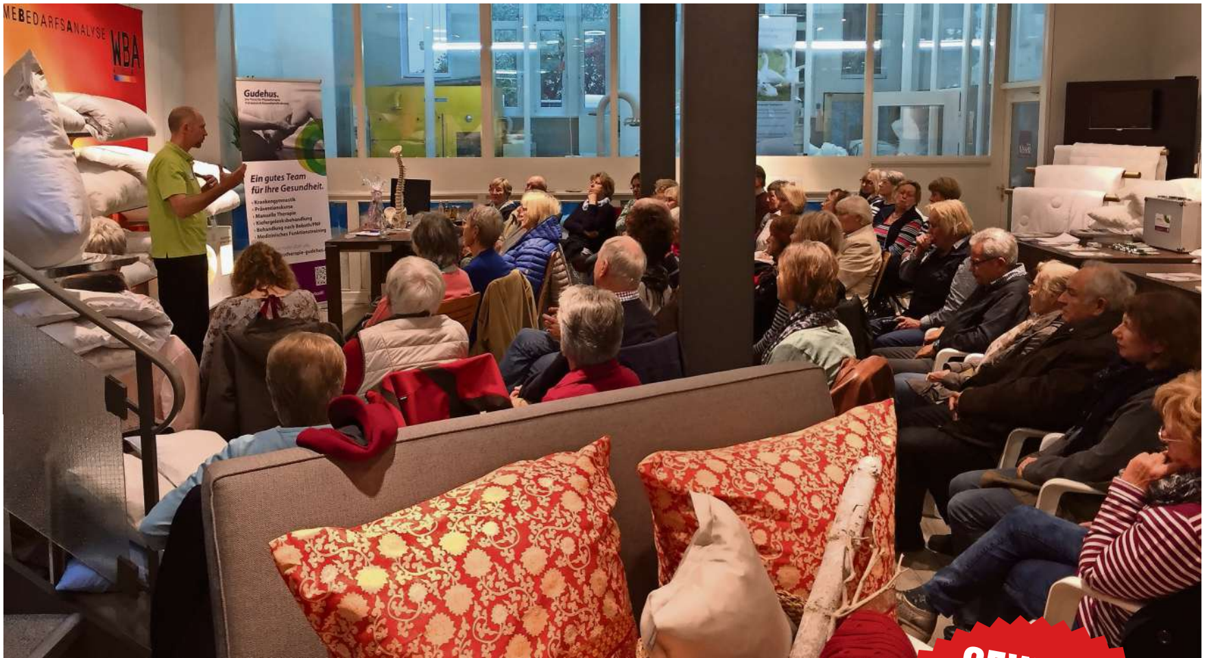
Bei den Info-Veranstaltungen steht Praxis im Vordergrund.